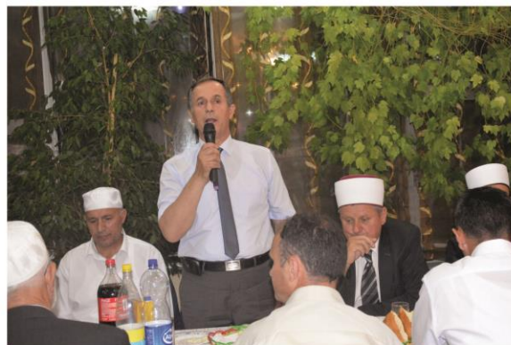
Iftari tradicional me familjet e dëshmorëve