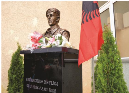
Pamje gjatë zbulimit të bustit të dëshmorit Ruzhdi Gjyliqi