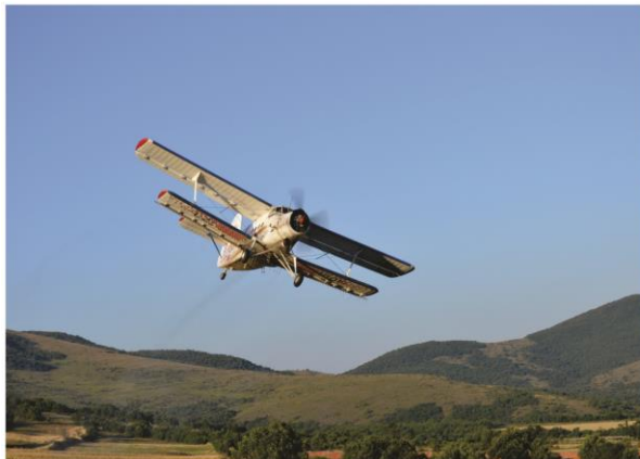
Fillimi i spërkatjes nga ajri

Nr. 128- Korrik 2014 ZYRA PËR INFORMIM - http://kk.rks-gov.net/malisheve/