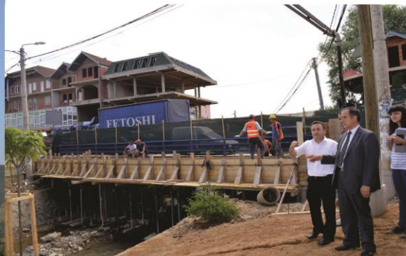
Fillimi i zgjerimit të urës së qytetit