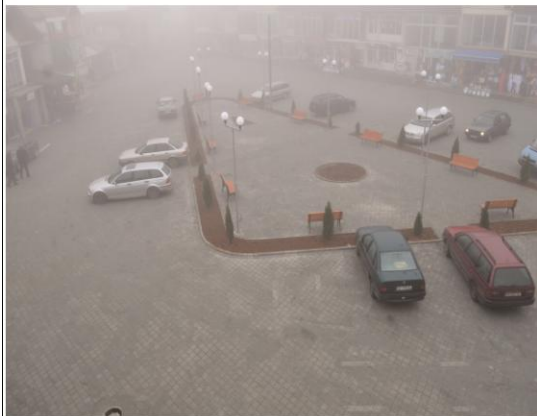
Oborri i tregut në Malishevë

Nr. 133- Dhjetor 2014 ZYRA PËR INFORMIM - http://kk.rks-gov.net/malisheve/