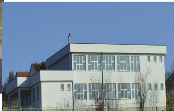
Shkolla në Gollubovc