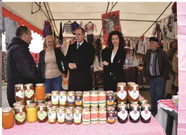
Panairi i veshjeve dhe ushqimeve tradicionale