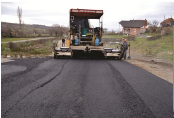
Asfaltimi i rrugës në Vërmicë