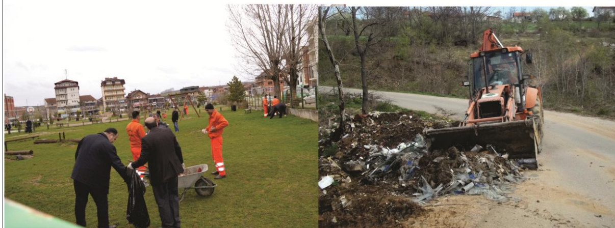
Pamje gjatë pastrimit të ambientit