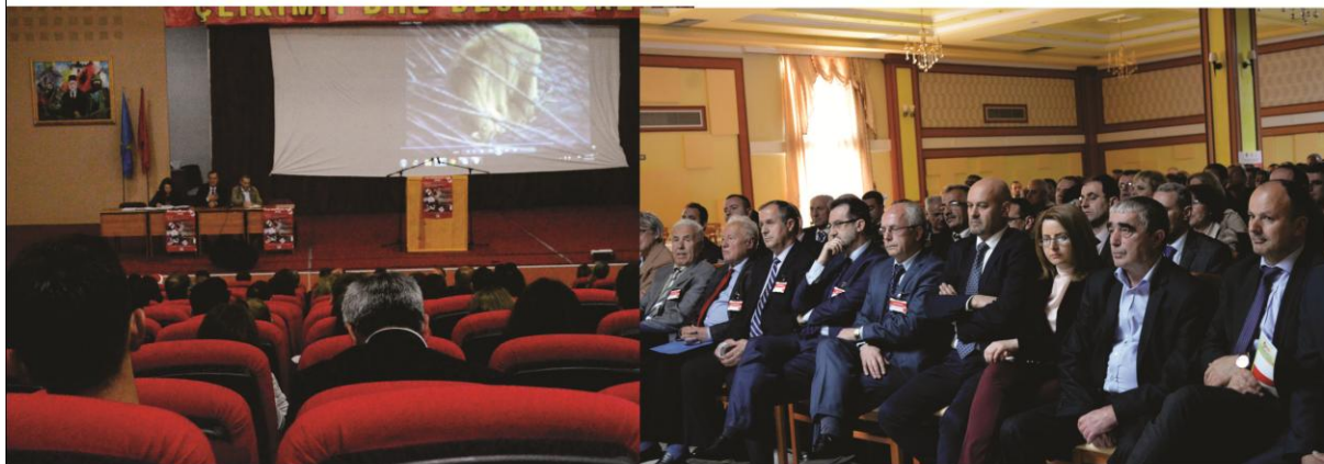
Tribuna profesionale për EHKK dhe masat parandaluese

Nr. 137-Prill 2015 ZYRA PËR INFORMIM - http://kk.rks-gov.net/malisheve/