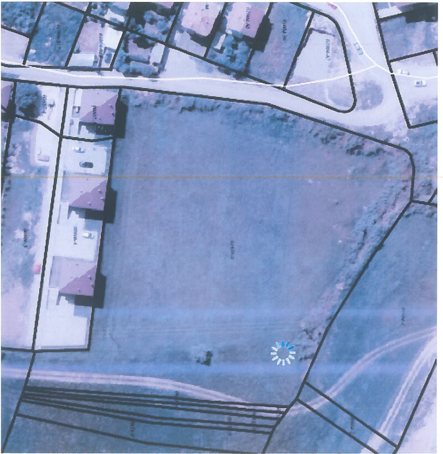
Figure 1: Aerial view of the site showing the location of the proposed solar array (indicated by the blue sun icon) and the surrounding residential development.